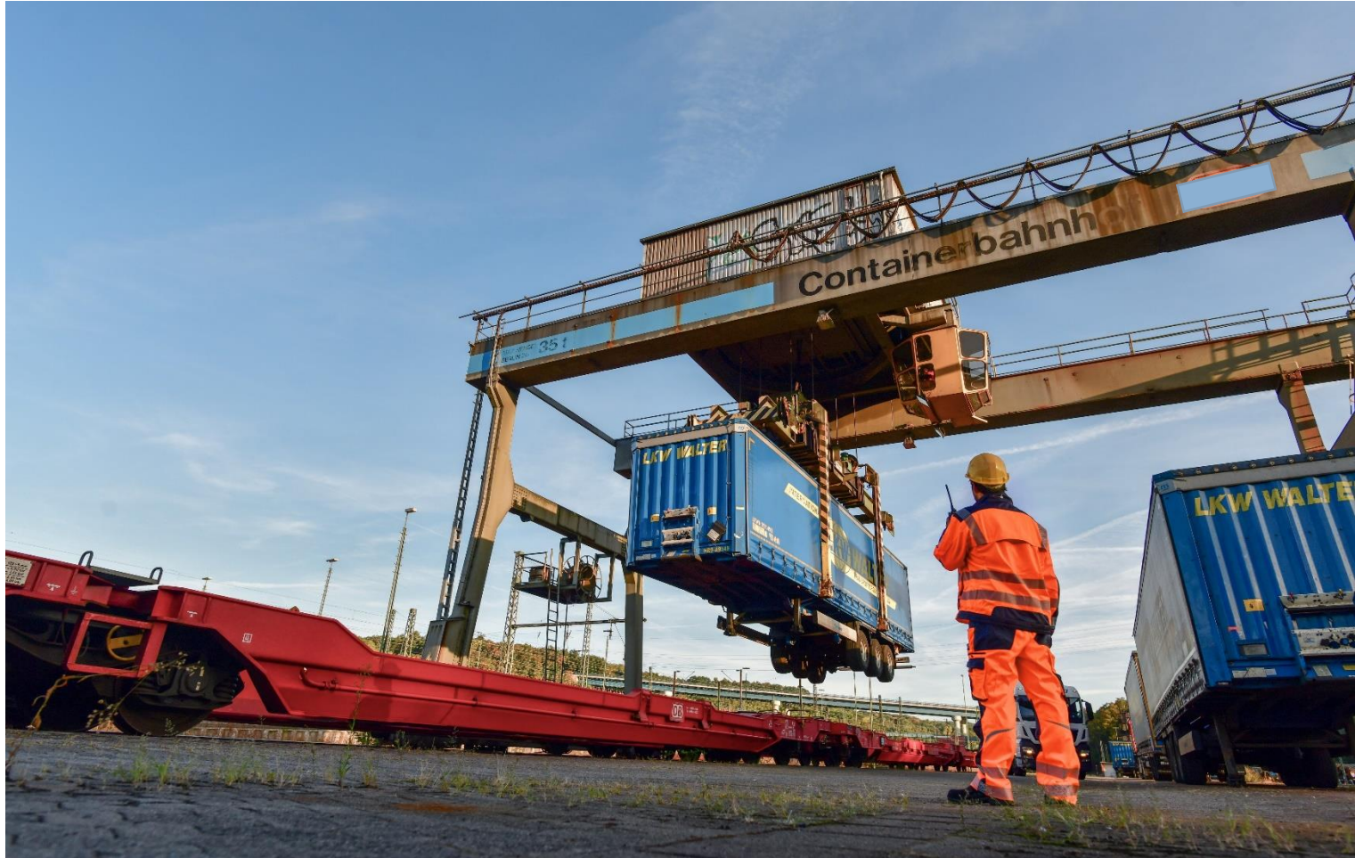
Containerumschlag im RBF Saarbrücken