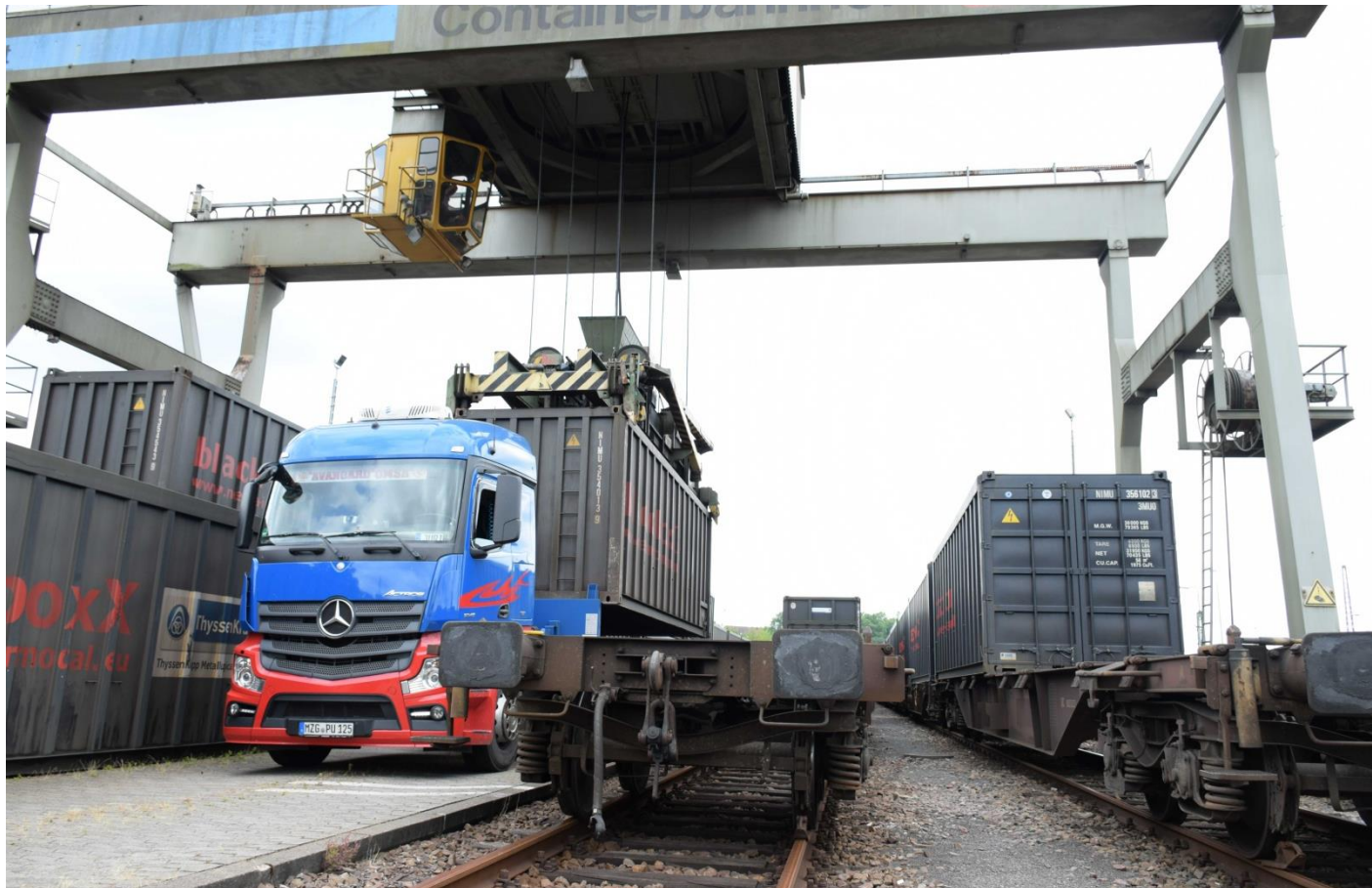
Containerumschlag im RBF Saarbrücken